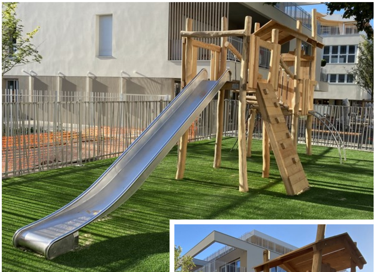
Photos sur cette page Tour Archy référence E632